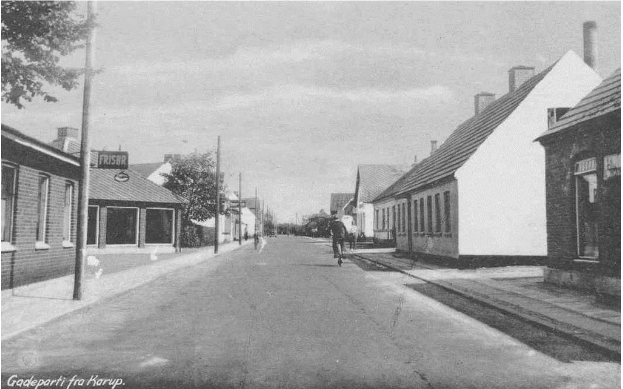
Gadeparti fra Karup.

På dette billede ses (umiddelbart efter frisørsalonen) en meget speciel bygning, der nu er revet ned. Den blev kaldt "blækhuset", og i gamle dage, d.v.s. fra 1905, til man i 1918 byggede det nye elværk, blev den brugt til opbevaring af batterier. Vandmøllen lavede nemlig kun strøm fra kl. 19 til kl. 6 morgen, og for at klare strømforsyningen om dagen var det derfor nødvendigt at lade på batterierne efter sengetid.