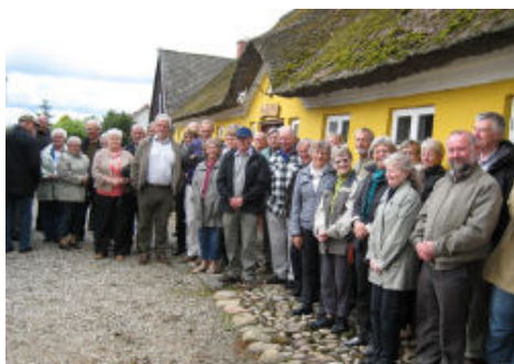
Deltagerne i busturen samlet foran Grønhøj Kro.

Vellykket lokalhistorisk udflugt i lørdags.