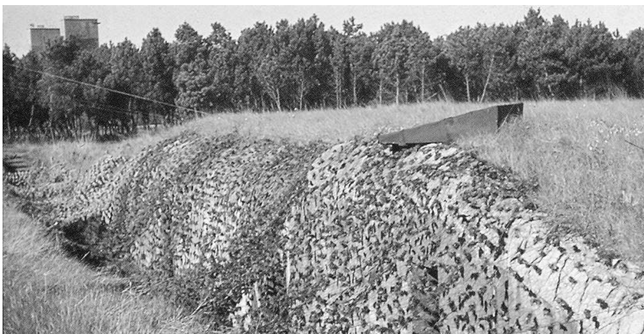
Kamoufleret bunker. Her ses en af de mange bunkere, som tyskerne byggede under krigen. Den er mange meter lang, men var vanskelig at opdage fra luften, fordi den var kamoufleret med sløringsnet.