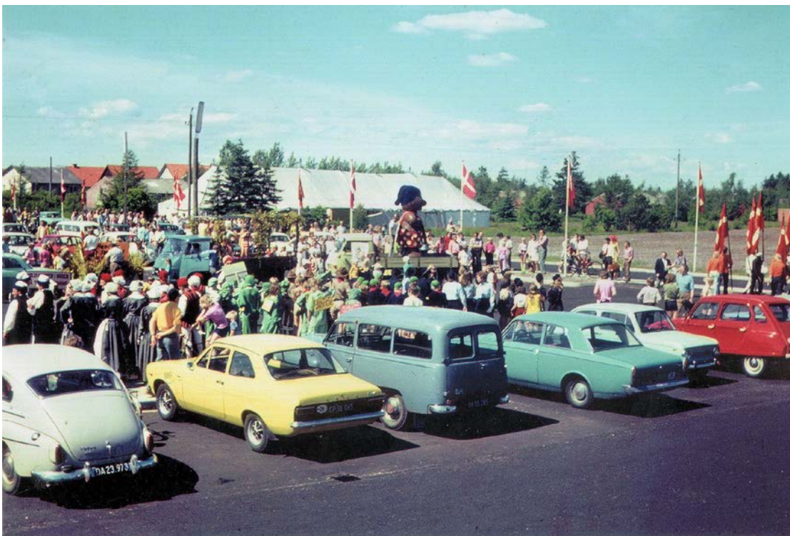
På parkeringspladsen ved Friluftsbadet ses folkedanserne til venstre. Ved siden af står en flok børn i grønne frødragter, syet af en lærer på Kølvrå skole. Bagest teltet, hvor ballet blev afholdt.