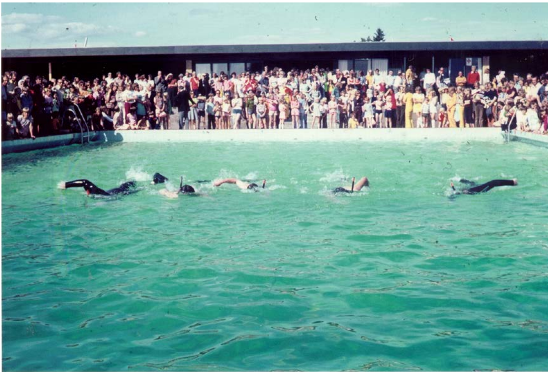
Langs bassinkanten var der fyldt med tilskuere til de mange aktiviteter.