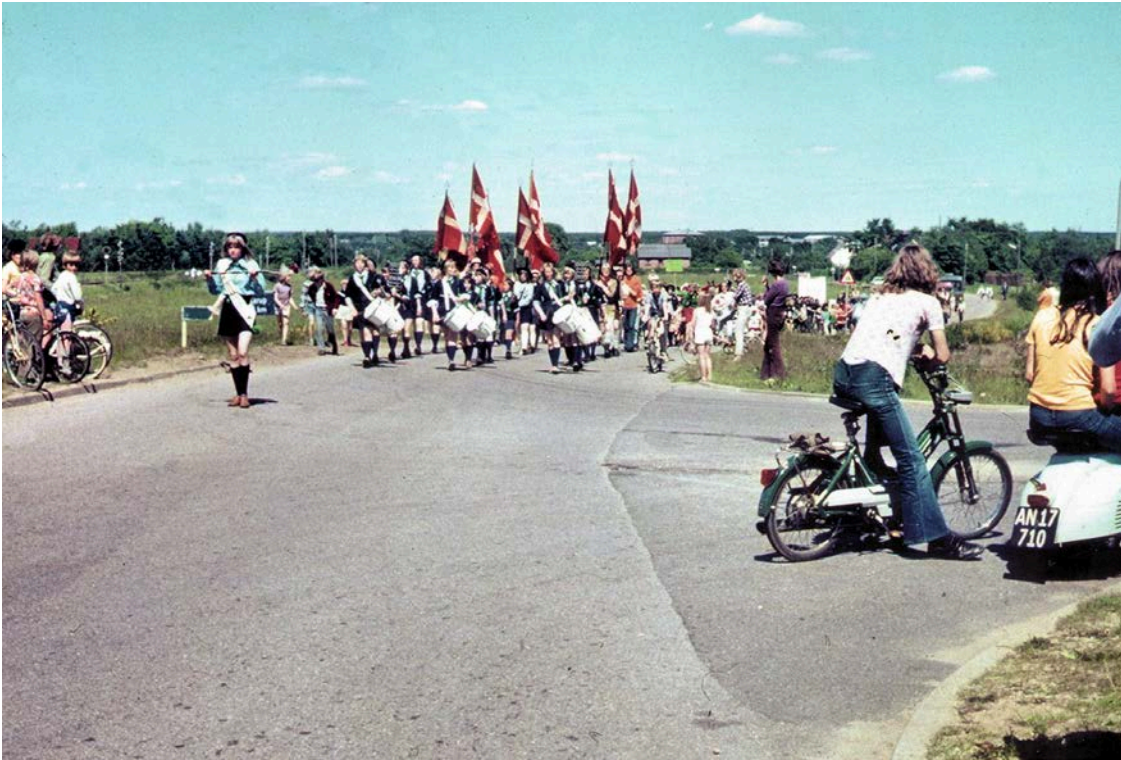
Her ankommer det festlige optog fra Karup med Holstebro Pige гарде i spidsen.