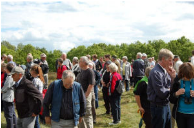
Deltagere i indvielsen.

Af Inger Merstrand, Lokalhistorisk Arkiv 2009