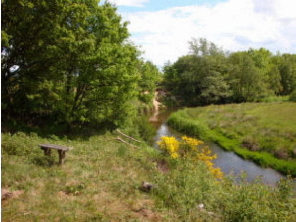
Her på bænken kan man sidde og nyde udsigten over Karup Å.