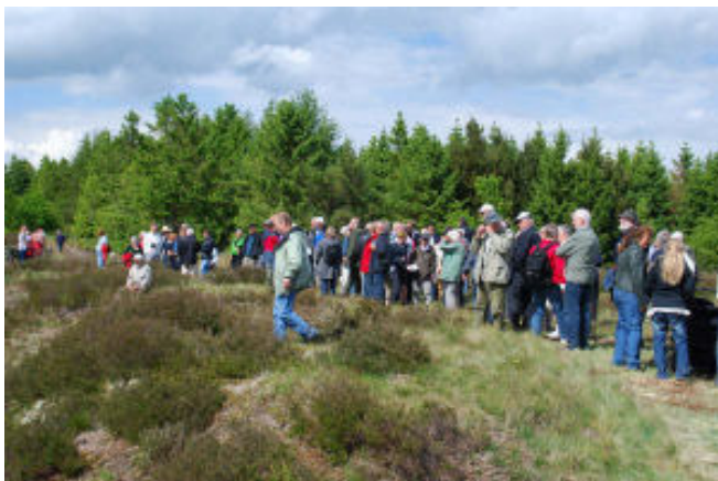
Et af de mange stop på turen.