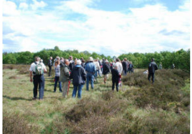
Ved middelalderagrene.