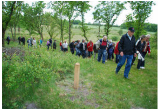
Op ad bakke.