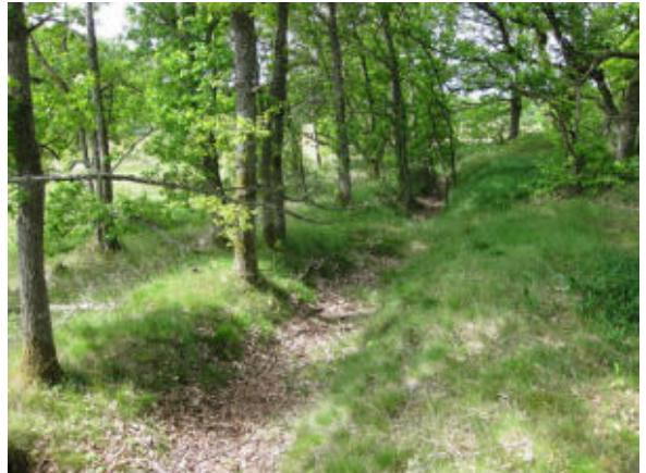
Engvandingsgrøft nær Karup Å.