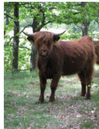
Køerne er nysgerrige, men meget fredelige.