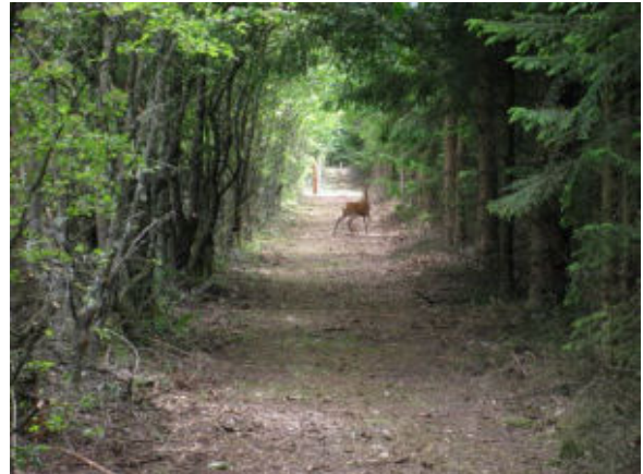
Man kan også være heldig at se et rådyr på naturstien.